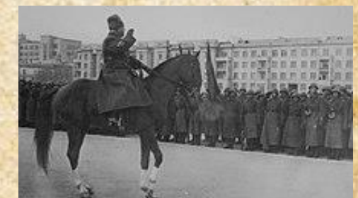
Маршал К. Ворошилов принимает парад

Парад длился полтора часа, став самым продолжительным из трёх проводившихся в стране парадов. В нём приняли участие 25 600 военнослужащих.