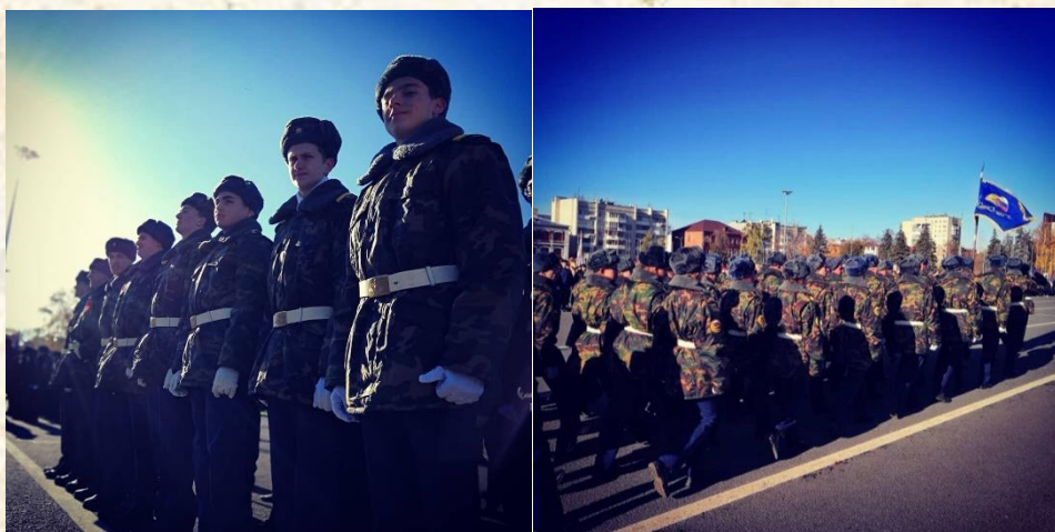
Смотр расчетов «Марш Устинова» 2018