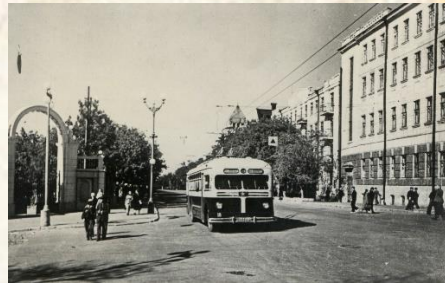
Куйбышев в годы Великой Отечественной войны

Несмотря на трудности военного времени, в области расширилась сеть творческих коллективов. Был создан симфонический оркестр, организован музыкальный лекторий государственной филармонии, хор русской песни, в Сызрани были открыты драматический театр, кукольный театр, детская музыкальная школа.