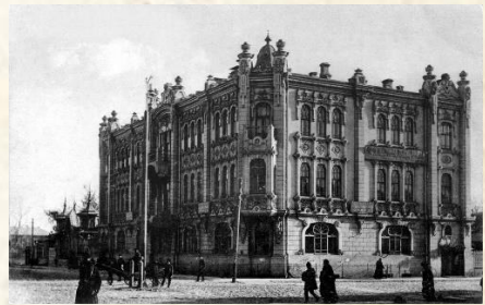
Куйбышев в годы Великой Отечественной войны

В военные годы Куйбышевская область внесла весомый вклад в общее дело на благо великой победы, став запасной столицей Советского Союза. Объединённые усилия людей, не утративших надежды и мужества, не отчаявшихся и не опустивших руки в то страшное время, обеспечили для нас мирное небо над головой.